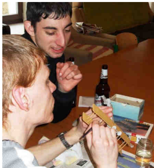
Soustředění obou Tomášů napovídá, že exponáty příští výstavy budou pohledné a zajímavé.

Sem tam zavítají na prázdniny do Linharta také fenka Žofka a její psi kamarádka Bonie. Obě se rády mazlí a společně s Ájou jsou pro každou lotrovinu. Když mají obzvláště dobrou náladu, vezmou do party i kočičího člena. Jen zlatá rybička se želvou nejsou příliš nakloněné společenským kratochvilím a každá dává přednost svému klidu. (Stáňa Lenkerová)