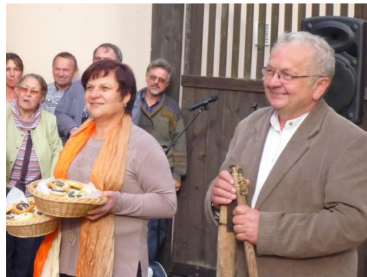
Hospodář s hospodyní vyslechli poděkování

V pátek 14. září se v píseckém Hotelu Bílá Růže uskutečnil další z pravidelných srazů členů Klubu dýmkařů Dýmka.net ( www.dymka.net ). Kromě oblaků dýmkového kouře je již po mnoho let dobrým zvykem těchto setkání pořádání benefiční dražby, kdy členové darují předměty a výtěžek z dražby putuje na předem vybraný charitativní, sociální či jiný účel. Čtenáři Čihovických listů mají možná v paměti rok 2009, kdy ve prospěch Domova sv. Anežky věnoval rekordní počet (pokračování na druhé straně)