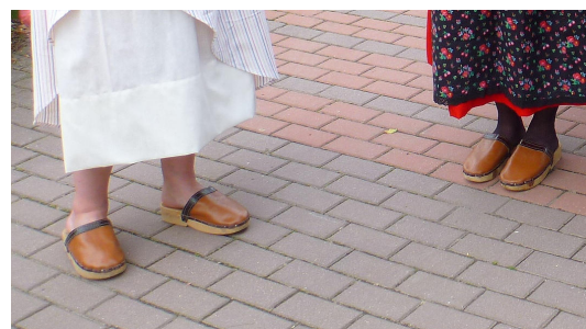
V hlavní roli byly tentokrát klapavé dřeváky