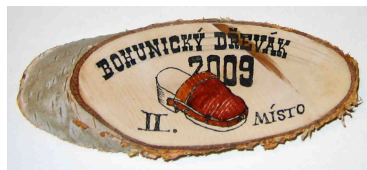
Tak to je on: Stříbrný Bohunický dřevák 2009

TROCHU ZÁVISLÝ OBČASNÍK Z DOMOVA SV. ANEŽKY A OKOLÍ 110. VYDÁNÍ vychází od května 2003 DUBEN 2009