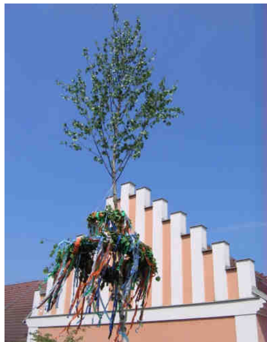
Stojí naše březová májka na samém počátku tradice?