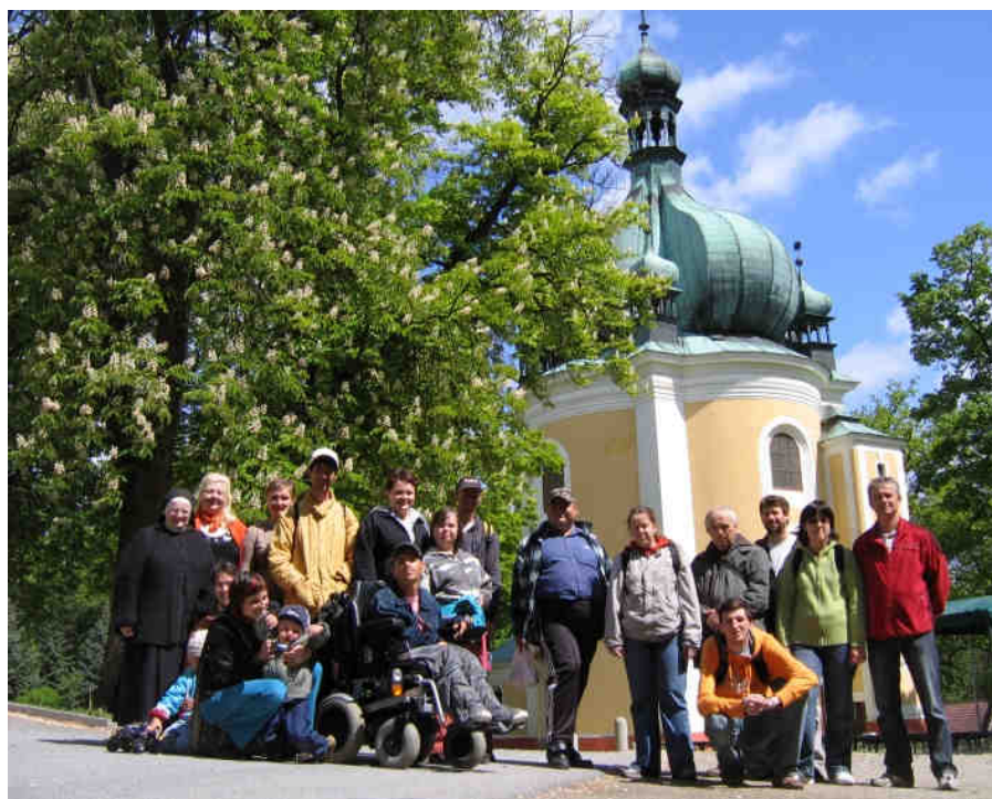
Návštěva poutního místa Lomec je velkým zážitkem. A když vám přeje slunce, není co dodat.