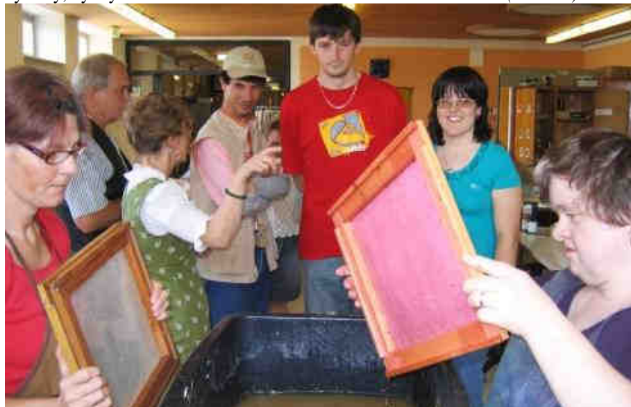
Prohlédli jsme si také kreativní dílny centra. Se zaujetím pozorujeme výrobu ručního papíru.