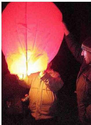
Vzlétá balónek štěstí.